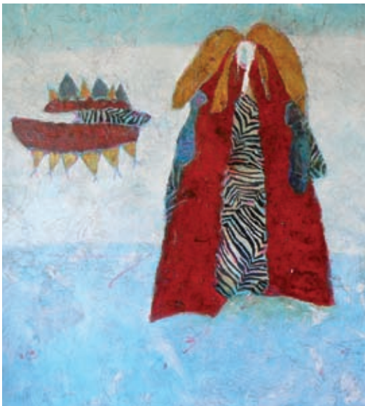
Etienne Bagchus Prinses Maxima